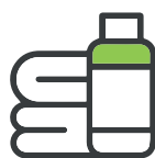
środki higieny i środki czystości